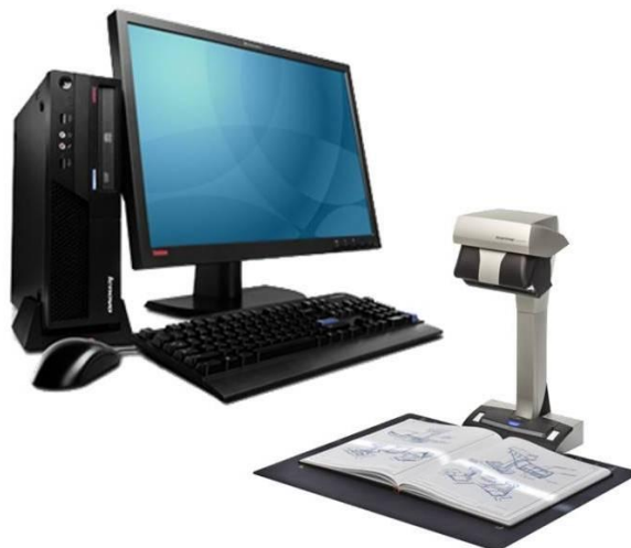
Зображення 1. Апаратно-програмний комплекс факсимільного переведення паперових документів в електронний вигляд

Цифрові копії страхового фонду виготовляються і зберігаються у вигляді окремих зображень високої роздільної здатності (600 dpi) формату .jpeg із збереженням кольору (на зображенні 2).